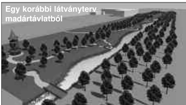
Egy korábbi látványterv madártávlatból

szükséges gondoskodni. A park jellegű részletekben pedig folyamatos, kertészeti módszerekkel történő növényfenntartás és ápolás fog megvalósulni.