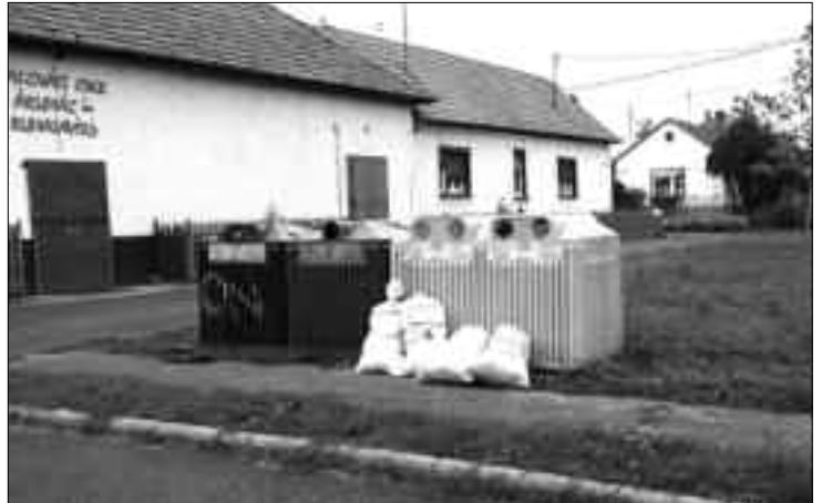
A szelektív szigetek dobozaiba üveget, papírt és műanyagot lehet behelyezni. A mellé lerakott zsákok illegális személtarakásnak minősülnek.

Az A.K.S.D. Kft. minden év április hónaptól egészen novemberig 10 cikluson keresztül végzi a