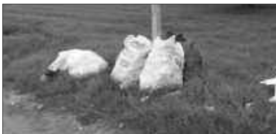
Szemétkupac a Józsapark mellett

Amint látható számtalan lehetőség van, így KÉRJÜK ÖNÖKET, A SZIGETEKET RENDELTETÉSSZERŰEN HASZNÁLJÁK, HISZEN HA MOSTANI ÁLLAPOT TARTHATATLANNÁ VÁLIK, AKÁR A SZIGETEK FELSZÁMOLÁSÁRA IS SOR KERÜLEHET, AMIRE VISZONT AZ ÜVEGEK SZELEKTÍV GYŰJTÉSE ÉS VESZÉLYESSÉGE MIATT SZÜKSÉGE VAN A JÓZSAIAKNAK.