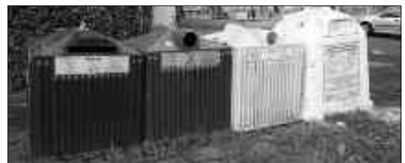
A Gönczy ovi előtti szelektív sziget - rendeltetésszerű állapotban