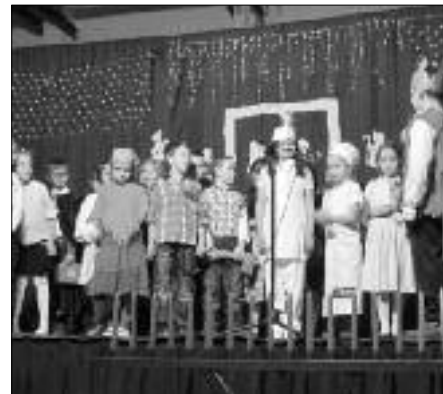
Adventi ünnepség a Gönczy Pál Ált. Iskolában