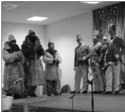
Adventi ünnepség a Községi Házban