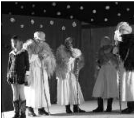
Adventi ünnepség a Lorántffy Általános Iskolában

előtti adventi ünnepeken. Mindhárom ünnepségről még több kép megtekinthető a www.jozsanet.hu weboldal galéria menüpontjában.